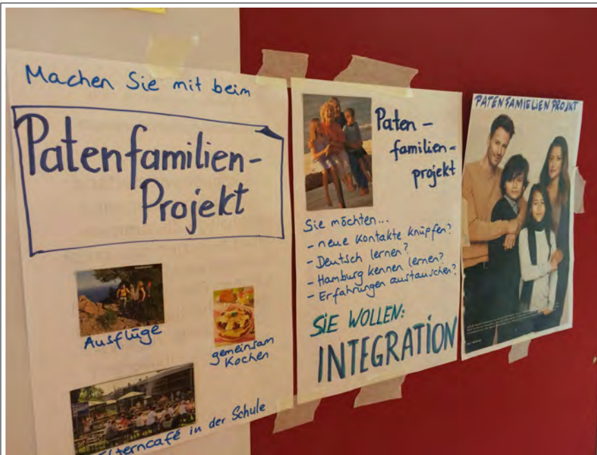
Plakat der Gruppe 2