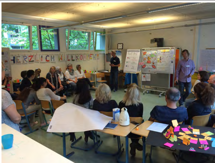
Präsentation der Ergebnisse anderen Teilnehmern , der IVK-Koordinatorin, der Standortleitung und interessierten Lehrer/innen