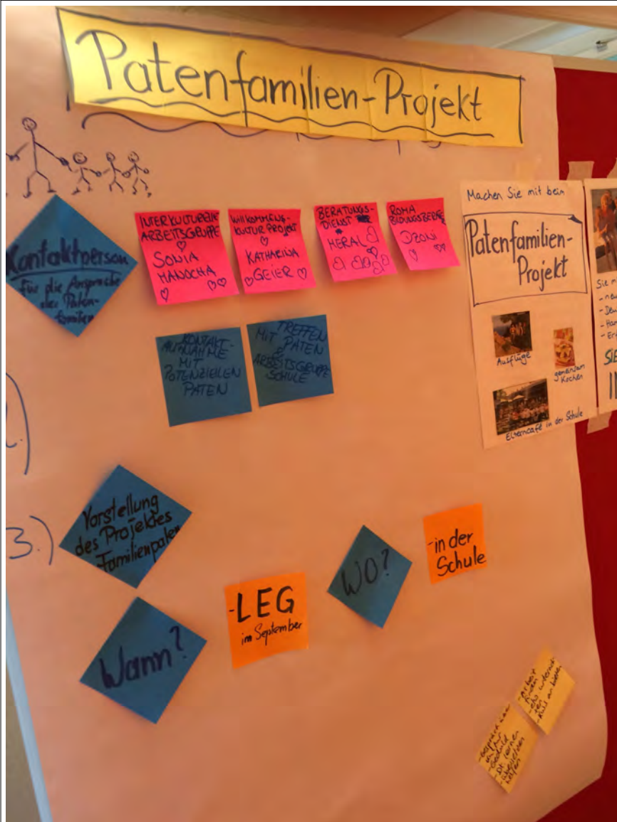
Plakat der Gruppe 2