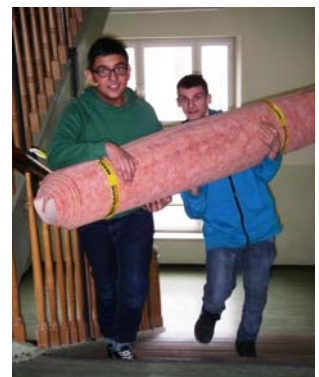
Freude über die Teppichreste