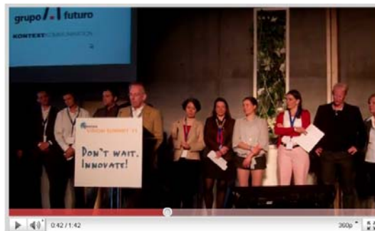
99 Sek. „Das macht Schule“ auf dem Vision Summit

Fast 1.000 Besucher waren dieses Jahr auf dem Vision Summit, der internationalen Leitkonferenz für Social Entrepreneurship, Social Business und Social Innovation. Wir waren dabei und konnten uns als eine von 16 beispielgebenden Initiativen vorstellen. Dazu gab es 99 Sekunden, in denen es galt die Teilnehmer für unseren Workshop zu begeistern. Der war voll. Hier das Video mit unserer 99-Sekunden-Vorstellung. – Übrigens: Besonders gut gefallen hat uns ein Workshop der Ev. Schule Berlin-Zentrum. Spannend auf der Schul-Homepage sind das Selbstverständnis , die Lern- und Schulkultur (Stichwort Verantwortung ) und die vielen Projekte !