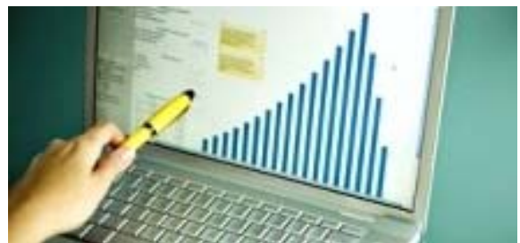
OpenOffice: Vergleichbar zu Microsoft, aber gratis!

Der sichere Umgang mit Word, Excel und PowerPoint qualifiziert auch für das spätere Berufsleben. Wo diese Programme aus Kostengründen nicht vorhanden sind, hilft die Gratisvariante OpenOffice. Hier findest du, wie du sie bekommst und was du damit machen kannst. Zu der Komplettversion gehört auch ein Datenbank- und Zeichenprogramm. Auch auf der Checkliste: Ein Tipp für Arbeitsgruppen (Schüler oder Lehrer!), die online gleichzeitig an den selben Dokumenten zusammenarbeiten wollen.