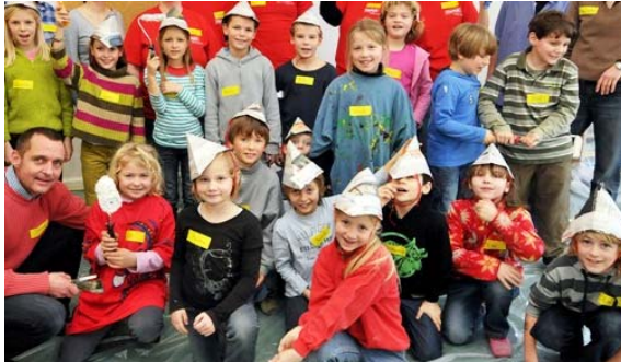
Ja, mit „Das macht Schule“ macht Schule richtig Spaß!

läuft auch nichts. Schecks nähren Nehmer-Qualitäten. Damit also gut gemeinte Hilfe nicht ins Gegenteil umschlägt, stellen wir unsere Erfahrung gern auch anderen Aktionen zur Verfügung. Wir verfolgen gespannt, inwieweit die beiden Projekte ähnlich nachhaltige Ziele verfolgen und erreichen. Schreiben Sie uns Ihre Meinung: kontakt@das-macht-schule.net