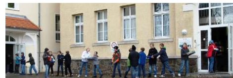
Stollenkette quer über den Schulhof ...

www.das-macht-schule.net/aktion/schulstollen