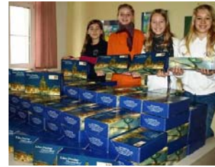
Fertig für die Verteilung ...

Eine Bibliothek mit vielen Regalen und einer gemütlichen Lesecke, das wünschen sich die Schüler am Borsdorfer Gymnasium. Das fällt nicht vom Himmel. Also wurden Stollen verkauft. Bei