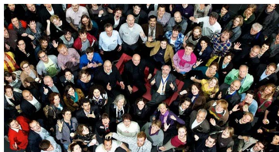
Workshop am Hasso-Plattner-Institut

Die These: Das aktuelle Schulsystem bildet unsere Schüler nicht zu verantwortungsvollen Menschen aus. Ihnen wird beigebracht, mehr an sich selbst und die eigene Karriere zu denken, anstatt sich als Teil einer Gruppe zu verstehen und für andere Verantwortung zu übernehmen. Die Herausforderung: Schule sollte das Verantwortungsbewusstsein stärken, die eigene positive Wirkung auf Gesellschaft und das direkte soziale Umfeld erfahrbar machen, soziale Handlungsverantwortung durch Verantwortung übernehmen ermöglichen und "Entrepreneurial Skills" vermitteln. – So wurde es formuliert, als im April Europas größter „ Design Thinking “ Workshop mit 250 Teilnehmern in Potsdam stattfand. Dort wurden in interdisziplinären Gruppen anwendungsorientierte Konzepte für verschiedene Bereiche erarbeitet. Wir konnten uns beim Workshop "Schule der Verantwortung - Verantwortung erfahrbar machen" einbringen. Unser Fazit: Der Workshop bestätigt, dass unser Ansatz genau diese Herausforderung hervorragend abdeckt!